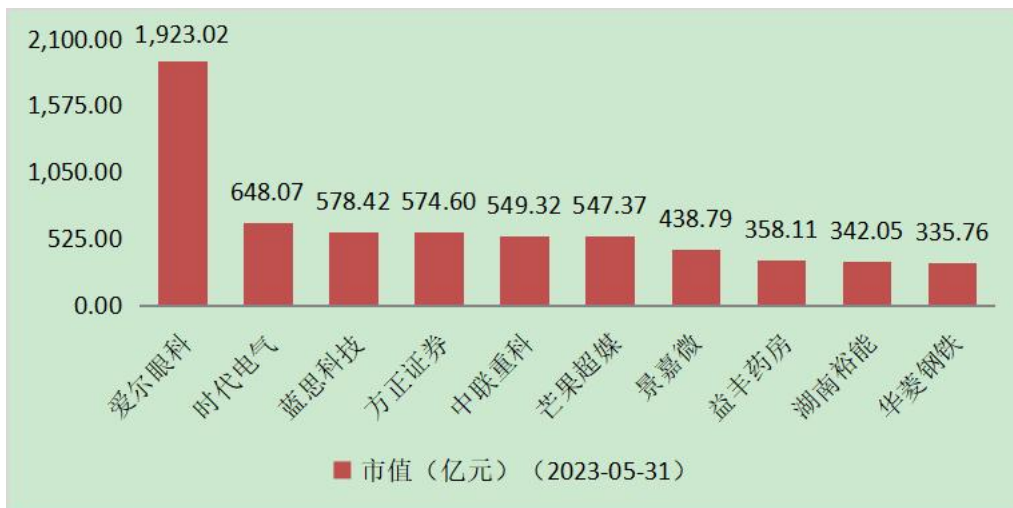
图3 月成交额排名前十的上市公司